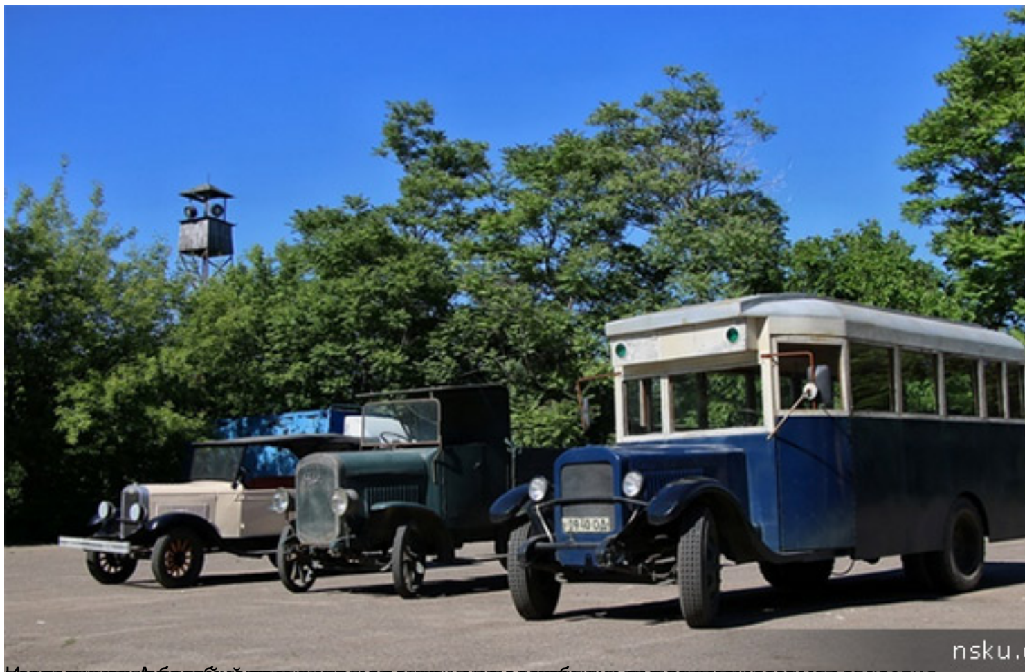
Коллекция автомобилей в музее истории города Новосибирска, посвященная столетию